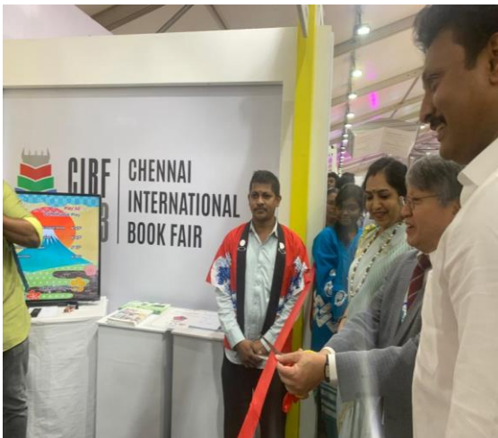
本官による日本ブースのリボンカット