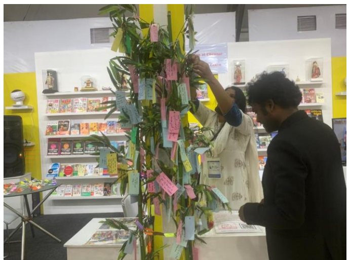
七夕祭り体験コーナー