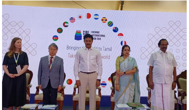
オープニングセレモニー