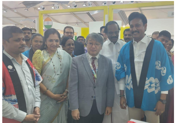
法被を試着したアンビルポイヤ・マゲシュ教育大臣