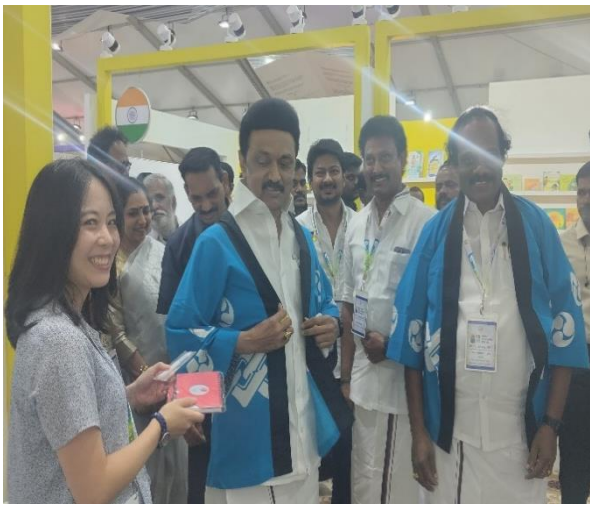
法被を試着するスターリン州首相