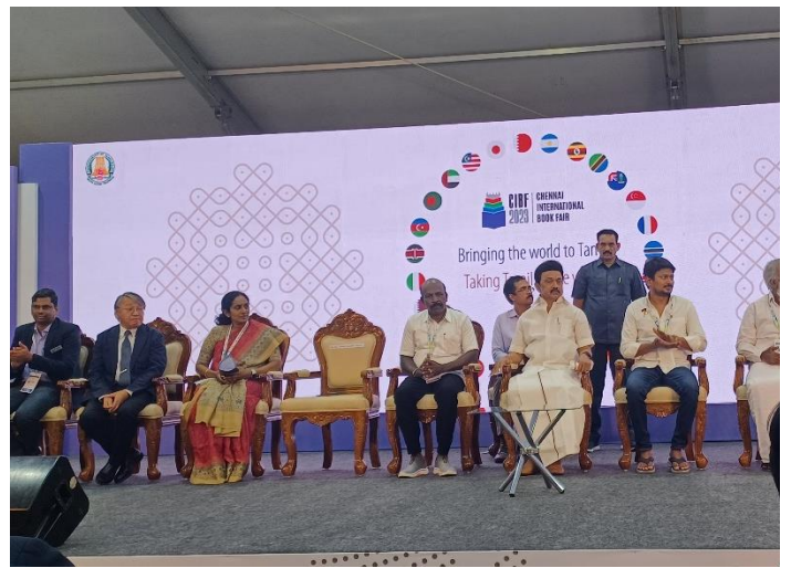
閉会式に出席した州政府関係者と多賀総領事