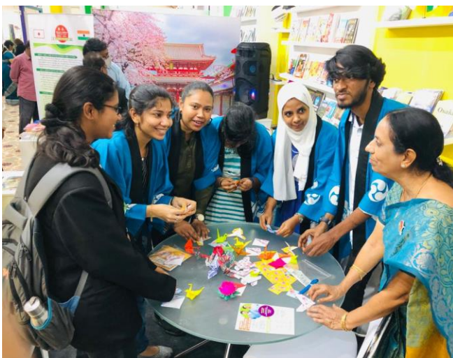
折り紙ワークショップを楽しむ来場者