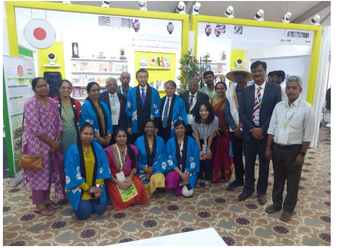
ABK-AOTS 同窓会タミル・ナド支部との集合写真