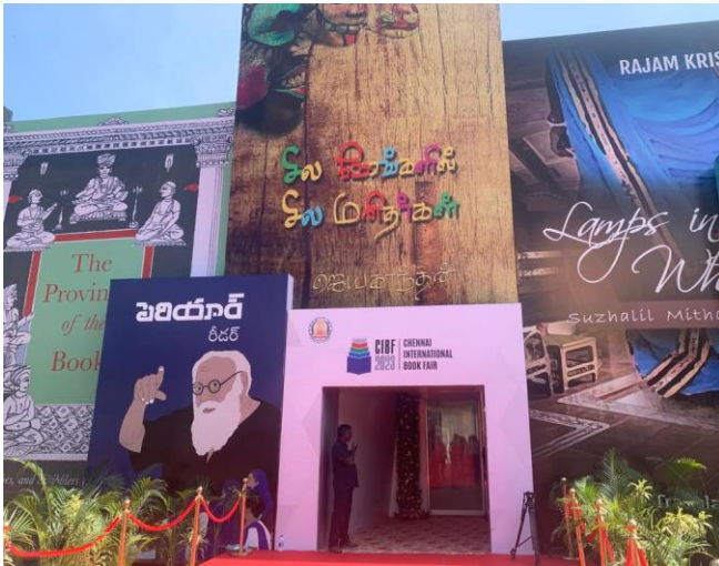
国際パビリオンメインエントランス